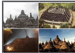
Gambar 1. Borobudur (11 point)

Semua gambar yang anda masukkan dalam dokumen harus disesuaikan dengan urutan 1 kolom atau ukuran penuh satu kertas, agar memudahkan bagi reviewer untuk mencermati makna gambar.