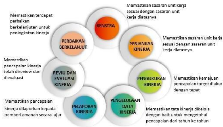
Gambar 2.1 Siklus proses berkelanjutan pada implementasi SAKIP

Perencanaan kinerja merupakan proses penyusunan rencana kinerja sebagai penjabaran dari sasaran dan program yang telah ditetapkan dalam rencana strategis untuk dilaksanakan sesuai dengan rencana capaian kinerja tahunan yang kriterianya termuat dalam indikator- indikator sasaran kinerja strategis pada tingkat sasaran dan kegiatan. Perencanaan kinerja dimulai dari tahapan menyusun Rencana Strategis kemudian dijabarkan dalam kontrak kinerja dilengkapi dengan target pengukuran kinerja, kemudian dilakukan pengelolaan data kinerja dan sampai dengan pelaporan kinerja. Serangkaian kegiatan tersebut merupakan siklus proses berkelanjutan pada implementasi Sistem Akuntabilitas Instansi Pemerintah (SAKIP) yang mana digunakan untuk perbaikan, peningkatan kinerja dan penguatan akuntabilitas instansi pemerintah serta untuk memonitor tindak lanjut dari rekomendasi hasil evaluasi periode sebelumnya.