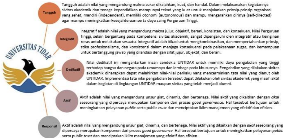
Gambar 2.2 Makna Nilai-nilai dasar kata UNTIDAR

Nilai-nilai dasar nama TIDAR dijabarkan sebagai berikut: